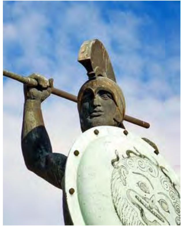
Imágenes N° 11 - 13: Monumento a Leónidas, Grecia