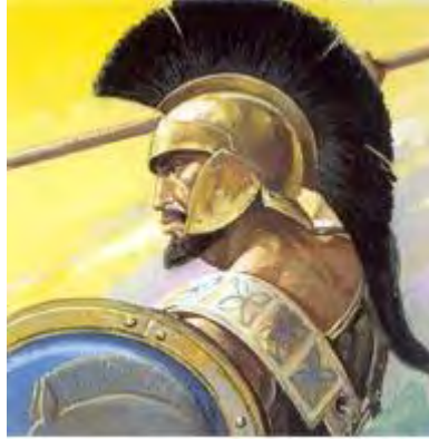
Imagen N° 19: La batalla de las Termópilas (480 BC), por Massimo Taparelli d'Azeglio (Turín, 24 de octubre de 1798 – Milano 15 de enero de 1866)