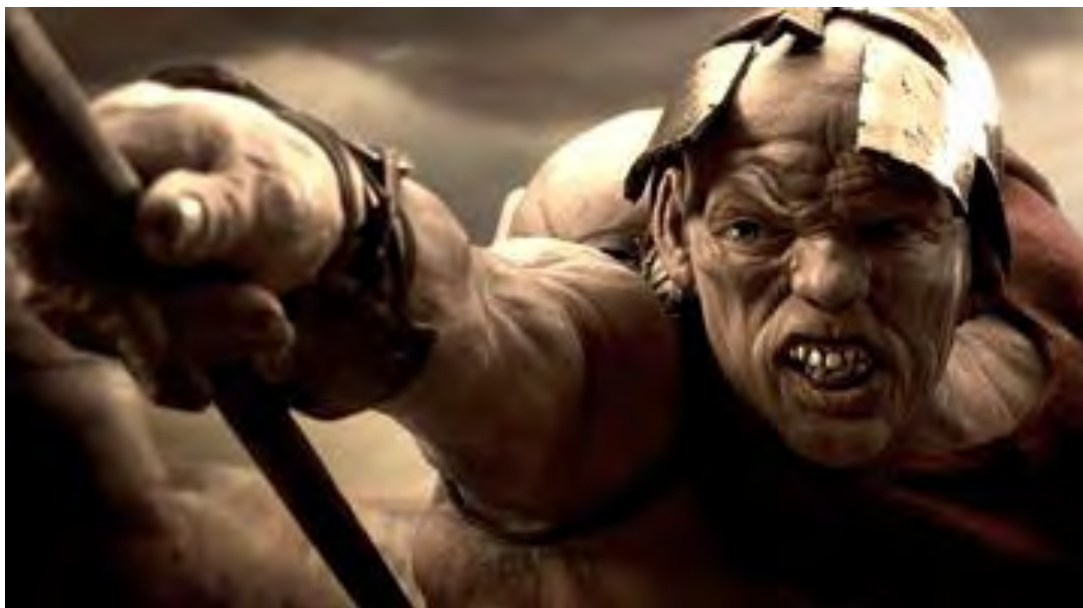
Imagen N° 21: La batalla de las Termópilas (ilustración artística)