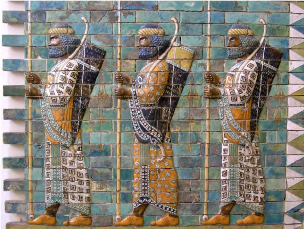
Representación de soldados persas del cuerpo de los Inmortales (museo de Berlín)