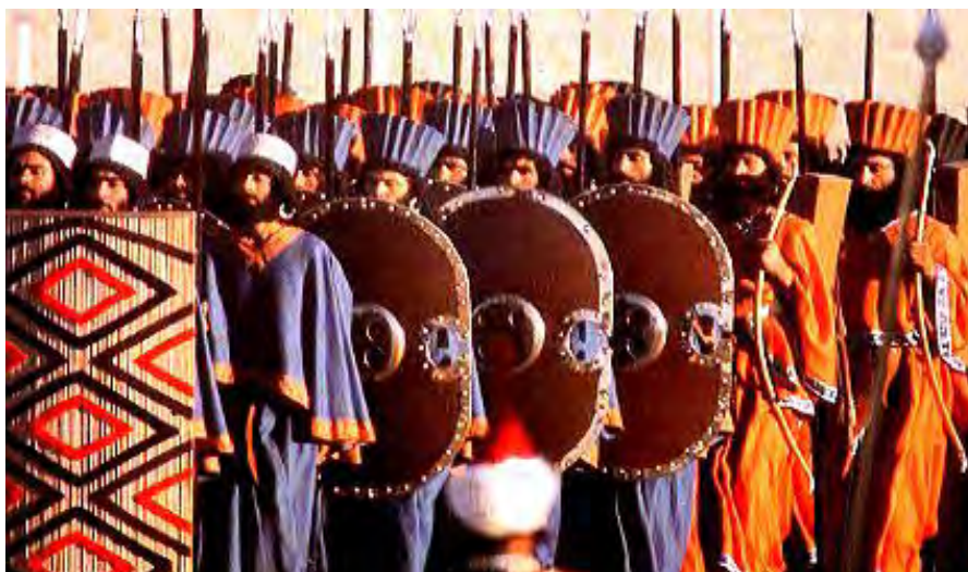
Los Inmortales, representación en vivo que se hizo en Irán en 1970