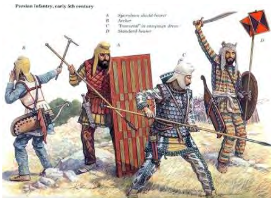
Inmortales en acción