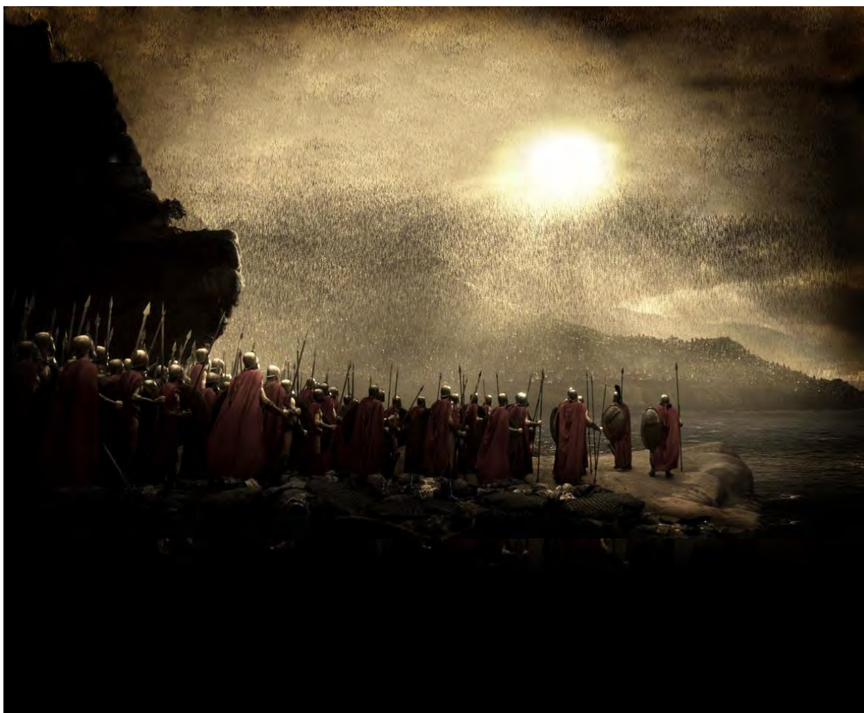
Lluvia de flechas persas